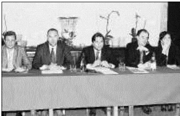
Il tavolo delle libertà durante l'incontro nella Casa della contadinanza